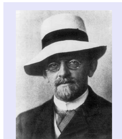
David Hilbert (1862–1943) è stato un matematico tedesco, probabilmente il più influente a cavallo tra il XIX e il XX secolo. Noto il per il suo approccio formalistico al problema dei fondamenti della matematica, si occupò anche di fisica, in particolare arrivò alle equazioni della relatività generale quasi parallelamente ad Einstein. L'azione, da cui seguono queste equazioni per principio di minimo, è detta "azione di Einstein-Hilbert". Sembra che abbia detto: "la fisica è troppo difficile per essere lasciata ai fisici".

In meccanica quantistica, lo stato di un sistema fisico è rappresentato da un raggio in uno spazio di Hilbert complesso e separabile (daremo la definizione di spazio separabile nel seguito) o, equivalentemente, da un punto nello spazio di Hilbert proiettivo del sistema.